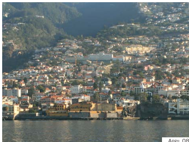
Fig. 6-18 – Forte de Santiago – vista de S

Aconselha-se o navegante a efectuar a sua aproximação com rumos N a NW podendo utilizar como marca de proa o Forte de Santiago ou a chaminé da Fábrica São Filipe . Uma vez safo do molhe basta alterar o rumo para W usando como marca os silos ou um dos hotéis nessa zona.