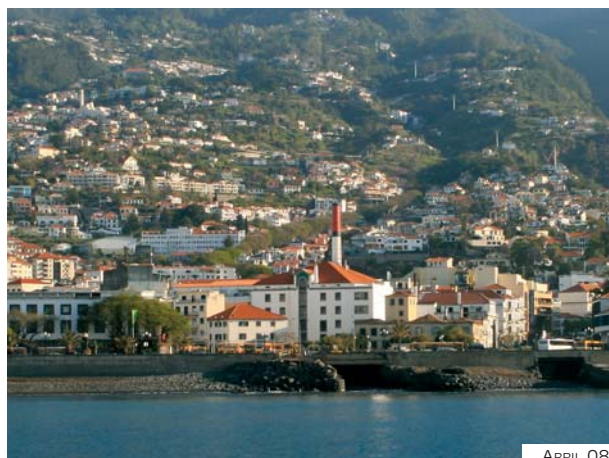
Fig. 6-19 – Fabrica de São Filipe – vista de S