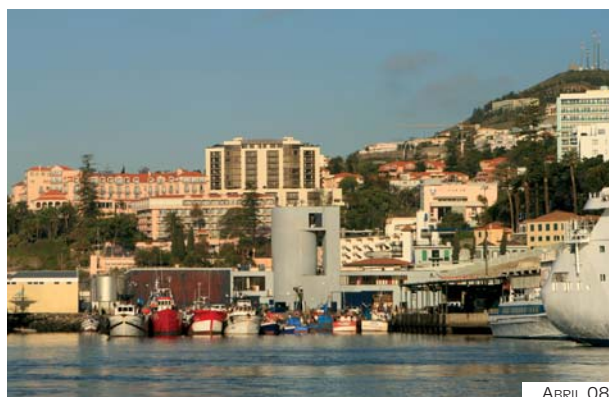
Fig. 6-20 – Hotéis – vista de SE