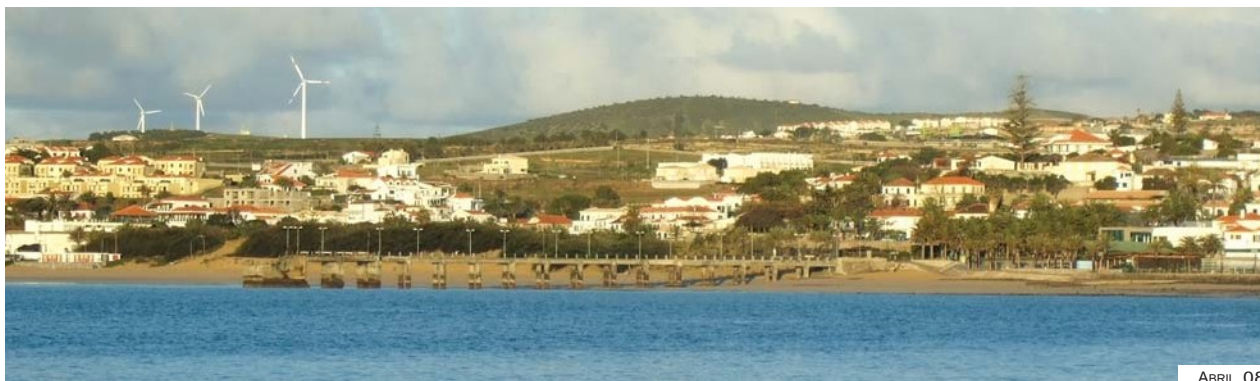
Fig. 4-5 – Ponte-cais – vista de SE