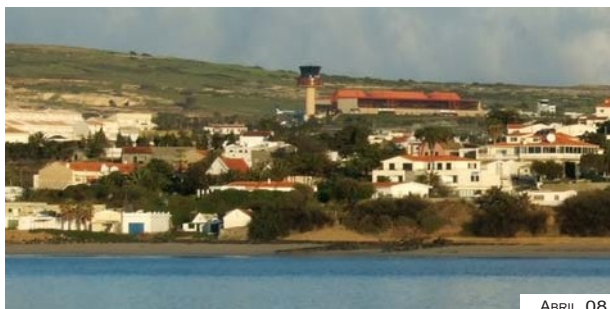
Fig. 4-4 – Torre do aeroporto – vista de SE

De noite os farolins dos molhes do porto são claramente identificáveis.