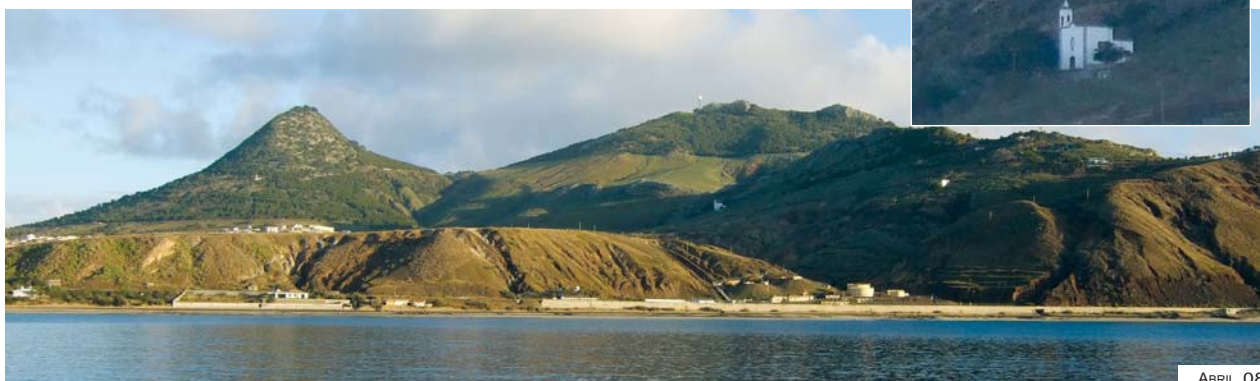
Fig. 4-6 – Igreja de Nossa Sra. da Graça – vista de S